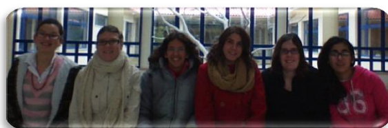
Grupo de Formação 1º ano

Nós gostamos dos funcionários e nós gostamos de algumas comidas do C.R.I.F. Nós achamos que o CRIF está muito bem organizado!”